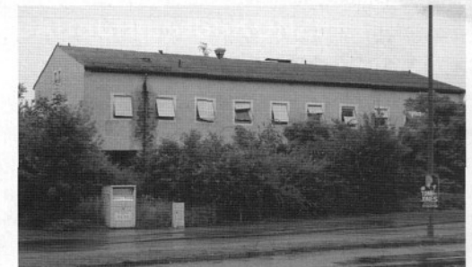
Landshuter Straße 107 „Gaststädte Pürkelgut“: 20 Jahre Anfang der 90er Jahre wurde das Gebäude von Thurn und Taxis verkauft und seitdem mindestens einmal versteigert. Zur Zeit gibt es Pläne, dort ein weiteres, überflüssiges Hotel zu errichten.