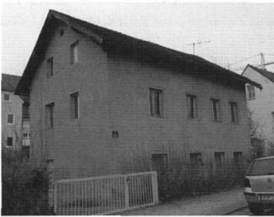
Dultplatz 1: 20 Jahre Wohnhaus mit geräumigem Hinterhof, liegt direkt am Donaukanal.