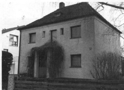
Mitterweg 2b: 15 Jahre Dieses Haus mit großem Garten steht laut Nachbarn schon seit 15 Jahren leer. Die Eigentümerin will einfach nicht vermieten.