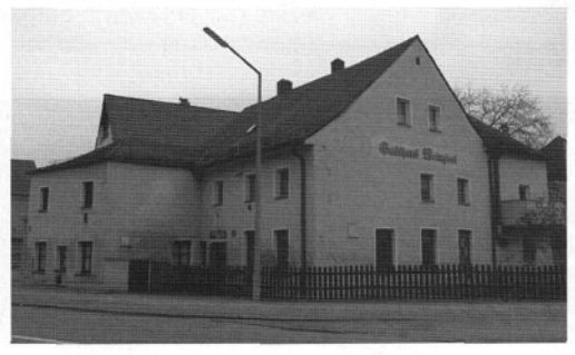
Reinhausen 4 „Gasthaus Weinzierl“: 20 Jahre Es ist ein Rätsel, warum es für dieses zentral gelegene Anwesen keine vernünftige Verwendung geben soll.