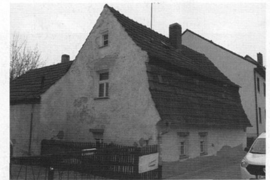
Holzgartenstr. 44: 15 Jahre Eigentlich mehr ein Häuschen als ein Haus, aber mit wunderschönem Streuobstgarten.