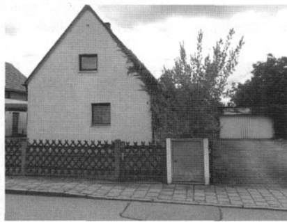
Königshütter Str. 7: 20 Jahre Kaum zu glauben, dass dieses schicke, kleine Häuschen schon so lange leer steht.