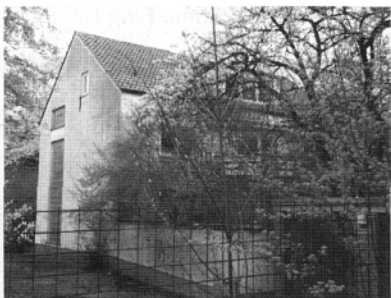
Grunewaldstraße 9: 19 Jahre Dieses geräumige Haus mit wunderschönem Garten steht seit 1998 leer. Ein Gruppe, die sich Hausretter*innen nennen, versuchten im August die Räume wieder mit Leben zu füllen, wurden aber von der Polizei geräumt.