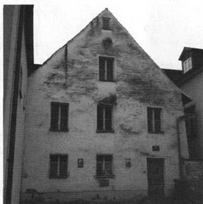
Pfaffensteiner Weg 14: 18 Jahre Kleines Haus, welches seit dem Ableben der letzten Bewohnerin leer steht.